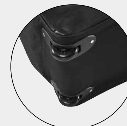
Leicht laufende Rollen aus Gummi