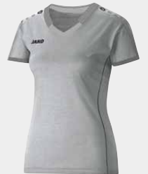
Taillierter Damenschnitt in allen Farben