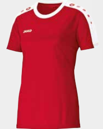
Taillierter Damenschchnitt in den Farben 00, 01, 04, 08, 16, 22