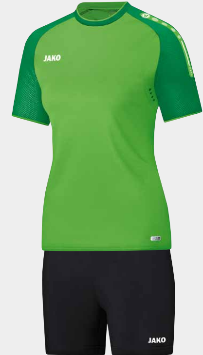
INDOOR TIGHT 2.0