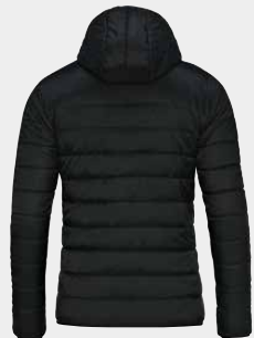
Ausgesparteter Rückenbereich für Vereins-Veredelung