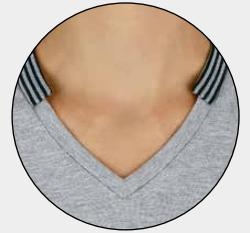
V-Neck mit elastischem Designelement